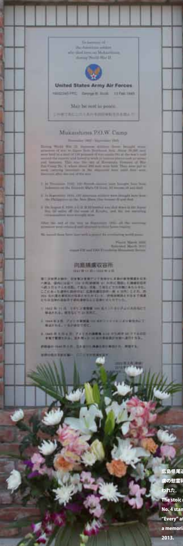
広島県尾道市のスーパー「エブリイ」の壁の外側に設置された、米兵捕虜の慰霊碑。4月15日、関係者が出席する中、この慰霊碑の除幕式が行われた。 The stoic monument to Hiroshima Prisoner of War Sub-Camp No. 4 stands right outside the wall on the grocery store named "Every" at Onomichi City, Hiroshima Pref. Dignitaries attended a memorial relocation and dedication ceremony held April 15, 2013.

ケニス・トロッター伍長 By Cpl. Kenneth K. Trotter Jr.