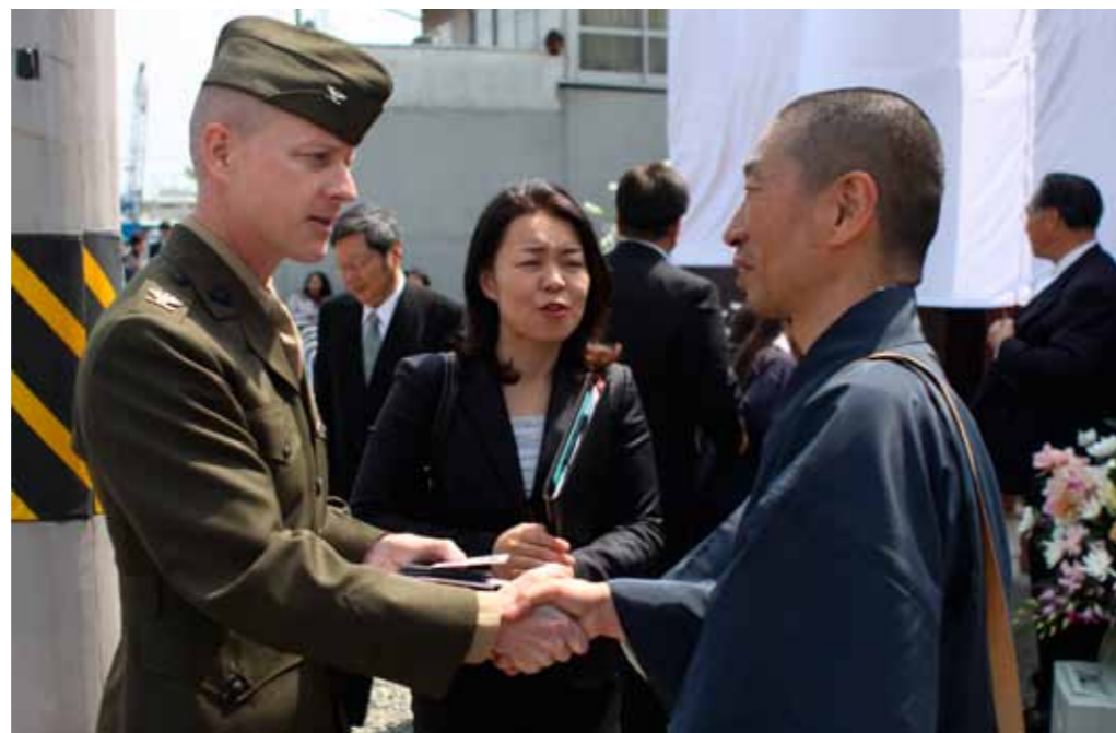
4月15日、広島県尾道市の戦争捕虜収容所跡地で行われた慰霊碑除幕式で、尾道観光協会理事の加藤慈然住職と話をし、岩国基地司令ジェームズ・スチュワート大佐。

慰霊碑の一つにはイギリス軍の部隊名が刻まれている。星条旗、ユニオンジャック、日の丸が頭上で風にはためきながら、犠牲者の慰霊碑を静かに見守っている。これらの国旗は、恒久平和を実現するために日英米が協力関係を継続していくことを表わしている。Etched in one of the memorial’s plated faces are the names of the British