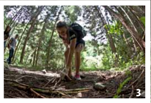
写真1,2,3:2013年5月17日に行われたシングル・マリン・プログラムの清掃活動で、岩国市二鹿野外活動センターと梅津の滝周辺の遊歩道を歩きながらごみを拾う基地ボランティア。