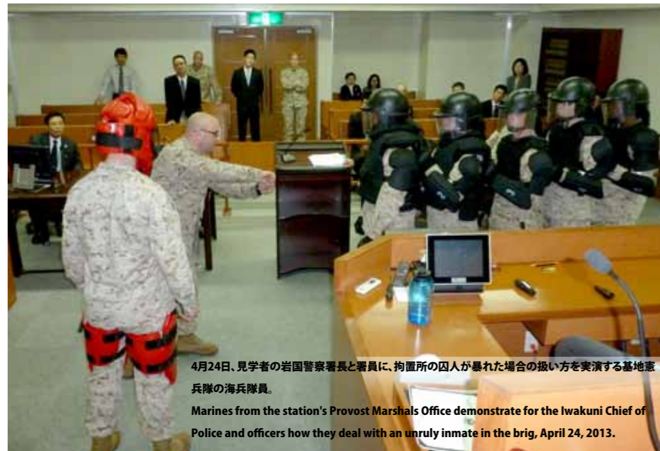
4月24日、見学者の岩国警察署長と署員に、拘置所の囚人が暴れた場合の扱い方を実演する基地憲兵隊の海兵隊員。 Marines from the station's Provost Marshal's Office demonstrate for the Iwakuni Chief of Police and officers how they deal with an unruly inmate in the brig, April 24, 2013.

これまでに行われたプログラムでは良い反響があった。日米の法執行機関が互いに連携し、学びあう関係を強調するために、同様のプログラムをこれまで以上に実施するべきである。If the response and interaction from this past orientation is any indication, there should be more events like this to highlight both agencies' commitment to working together and learning from each other.