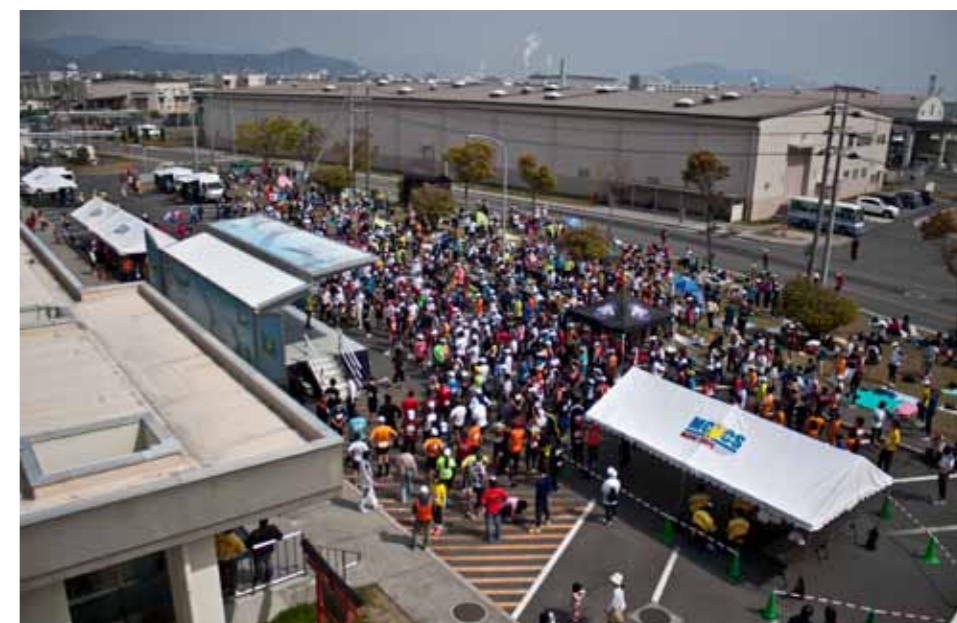
4月14日にアイアンワークスジム前からスタートした第46回キンタイマラソン大会で、フルマラソン開始前の様子。この大会には1,000人以上が参加した。 Participants in the 46th annual Kintai Marathon begin the full marathon portion of the race, which started in front of the IronWorks Gym here, April 14, 2013. More than 1000 people participated in the marathon.