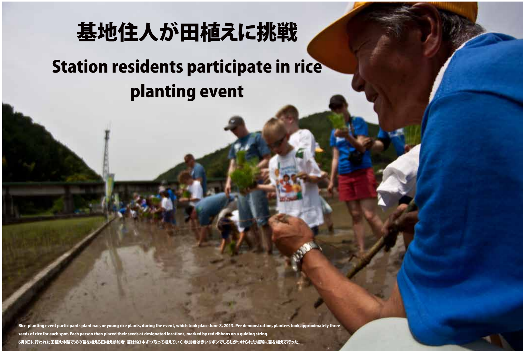
Rice-planting event participants plant nae, or young rice plants, during the event, which took place June 8, 2013. Per demonstration, planters took approximately three seeds of rice for each spot. Each person then placed their seeds at designated locations, marked by red ribbons on a guiding string.