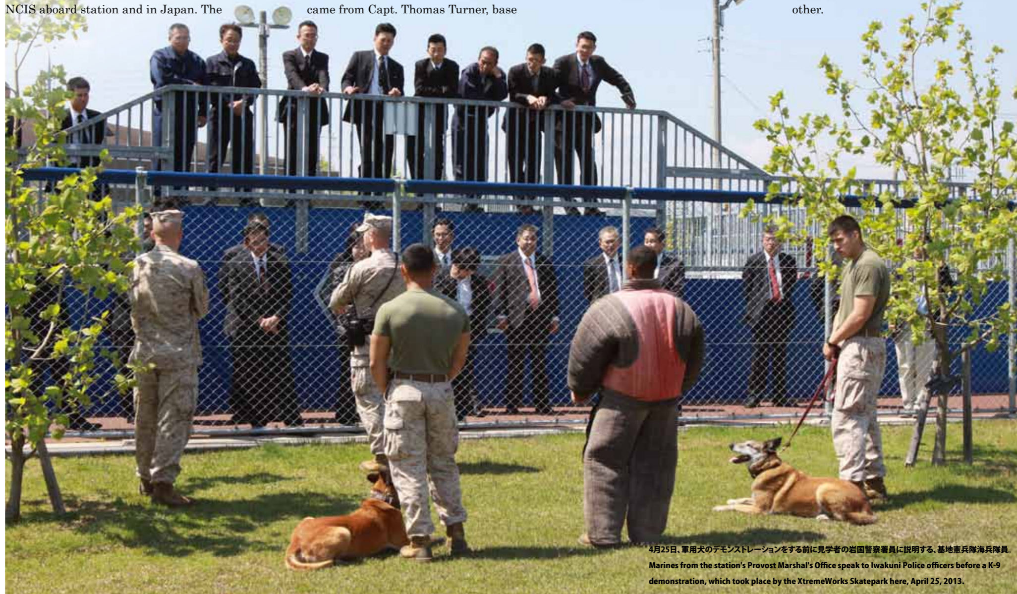
4月25日、軍用犬のデモンストレーションをする前に見学者の岩国警察署員に説明する、基地憲兵隊海兵隊員。 Marines from the station's Provost Marshal's Office speak to Iwakuni Police officers before a K-9 demonstration, which took place by the XtremeWorks Skatepark here, April 25, 2013.